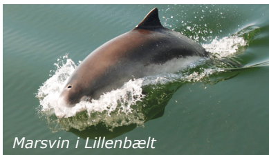
Marsvin i Lillenbælt

På fastlandet venter løberuter, vandreture, orienteringsløb, grøn fitness og meget mere. Nyd det hele og glæd dig over, at et aktivt friluftsliv både giver velvære og gavner helbredet. Gå en tur langs kysten og oplev de små hvaler, marsvinene, der boltrer sig i det evigt strømmende vand.