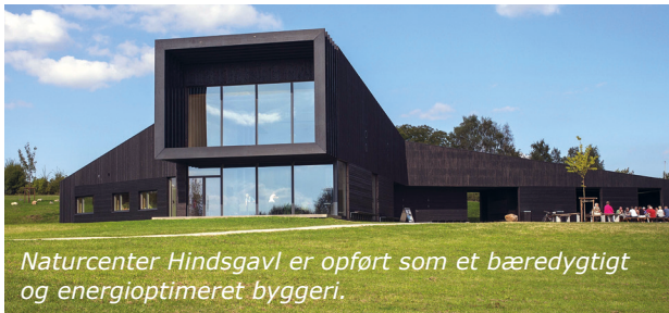
Naturcenter Hindsgavl er opført som et bæredygtigt og energioptimeret byggeri.

Naturcenter Hindsgavl er det naturlige omdrejningspunkt for de mange oplevelser på Hindsgavlhalvøen.