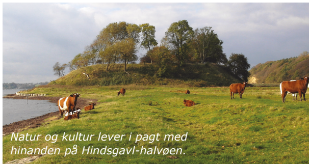
Natur og kultur lever i pagt med hinanden på Hindsgavl-halvøen.

Prøv undervandsstjerne som leder snorkel- og flaskedykkere på undervandstur langs afmærkede ruter. Stjerne er forsynet med infoskilte som fortæller, hvad man oplever undervejs.