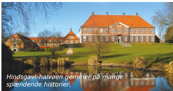
Hindsgavl-halvøen gemmer på mange spændende historier.

Langs kysterne er bevaret en række skanser fra de store krige fra 1600-tallet og frem, og mange steder kan du finde spor fra Danmarkshistorien.