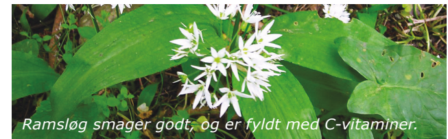
Ramsløg smager godt, og er fyldt med C-vitaminer.

I foråret er skovbunden dækket af planter med hvide blomster, der lugter stærkt af løg. Det er ramsløg, der både smager godt og har et ekstremt højt indhold af C-vitaminer.