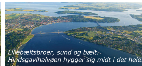
Lillebæltbroer, sund og bælt. Hindsgavlhalvøen hygger sig midt i det hele.