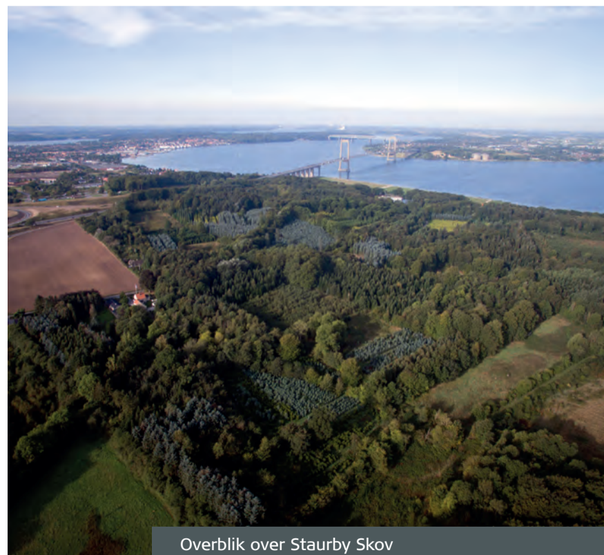
Overblik over Staurby Skov

Selvom mange af brugergrupperne er ens i de to naturområder, foreslås det at fordele nogle af brugergrupperne, så det ene område udvikles mere til nogle aktivitetstyper, mens der satses mindre på den type aktivitet i det andet naturområde.