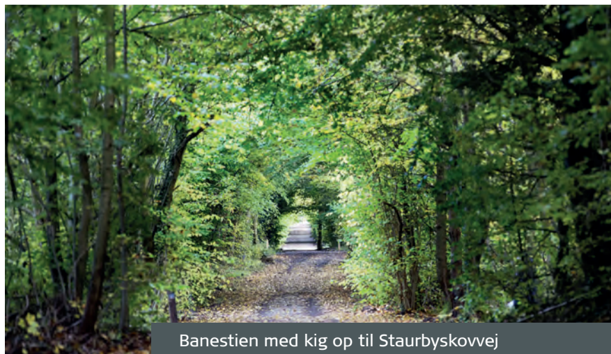
Banestien med kig op til Staurbyskovvej

I dag er det muligt for gående og cyklister at komme til Staurby Skov fra syd via Banestien, med indgang fra Hegnet. Efter forslag fra borgere og en række naboer til Staurby Skov, kan der etableres en ny indgang for cyklende og gående fra Strandvejen til Banestien lige nord for Den nye Lillebæltsbro. Det vil gøre indgangen til skoven lettere at finde for skovgæsterne, der kommer til skoven fra Middelfart-siden til fods eller på cykel. Det vil også være til glæde for skovens naboer på Hegnet, da der bliver mere ro på vejen, og der vil blive færre farlige trafikale situationer med hurtige cyklister, når beboerne skal ud af deres indkørsler.